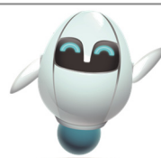
5Gマスコットキャラクター「メル」

※「メル」は三井住友トラスト・アセットマネジメントの5Gマスコットキャラクターです。