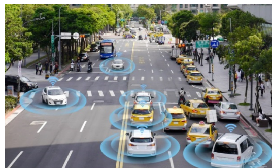
※写真は5Gで「つながる車」のイメージです。

自動運転には周囲を走行する車両や信号機等と通信し、情報を瞬時に送受信することが求められます。5Gが普及することで、この“高速・大容量”、“超低遅延”、“多数同時接続”の通信が可能になります。5Gで「 つながる車 」の開発が、自動車業界の再編にも つながる かもしれませんね。